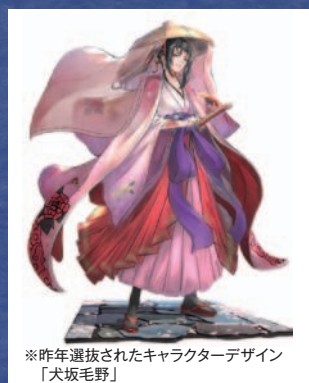
※昨年選抜されたキャラクターデザイン 「犬坂毛野」