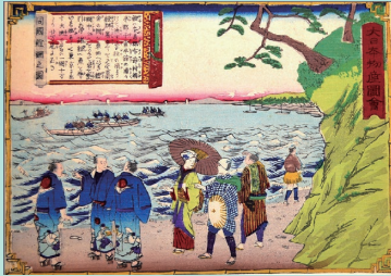
「大日本物産図会」三代歌川広重画 当館蔵 / 安房の鯛漁の風景