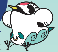
万祝展公式キャラクター ネロル