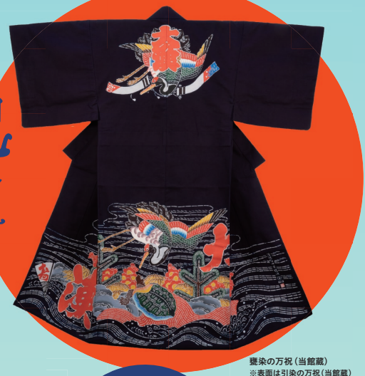
染染の万祝(当館蔵) ※表面は引染の万祝(当館蔵)