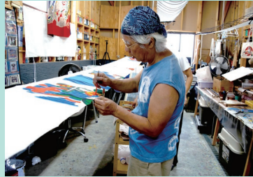
現在に受け継がれた万祝染色の技術