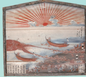
「地曳網絵馬」玉前神社蔵 / 九十九里の大漁風景