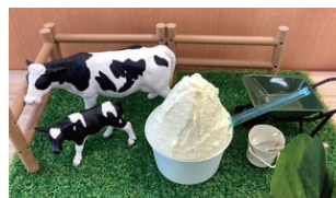
図 船橋市行田3-7-1 図 9:30~18:00 図 火曜日(祝日の場合は営業) 図 ☎047-439-3061

広々とした店内には、船橋の特産品・小松菜をはじめ多様な朝採れ野菜などが並べられています。地元の農家さんが採れたての野菜を直接売場に持ち込み、産地と生産者を記したシールを貼って販売する仕組みなので、鮮度と安心感が違います。