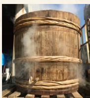
木樽を使った、独自製法 が受け継がれています