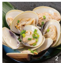
図 ヤマニ水産 ☎0479-67-5156