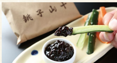
食べる醤油「ひ志お」は温かいご飯にのせても美味

山十の創業は1630(寛永7)年。江戸時代からの製法でつくり続け られている「ひ志お」は、大豆と大麦から麹を作り、銚子の自然を たっぷり吸いこませ、1年以上熟成させた発酵調味料です。店舗で はひ志おや醤油などの銚子の名産品を購入できます。