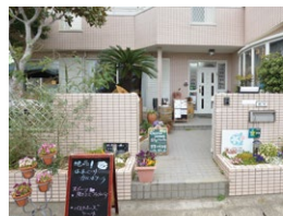
図 山武市松ヶ谷口3360-50

海さんぽとBBQが楽しめるカフェレストラン。九十九里地はまぐりと九十九里海塩、山武市の九十九里海っ子ねぎを使用するなど、地産地消にとことんこだわったラーメンは「はましお」と「ピリ辛」2種類の味が選べます。