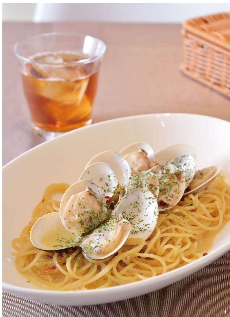
1. ぜんなのペペロンチーノ 1,200円

ぜんなならではの、凝縮されたハマグリの味わいと磯の風味をたっぷり含んだパスタは絶品!