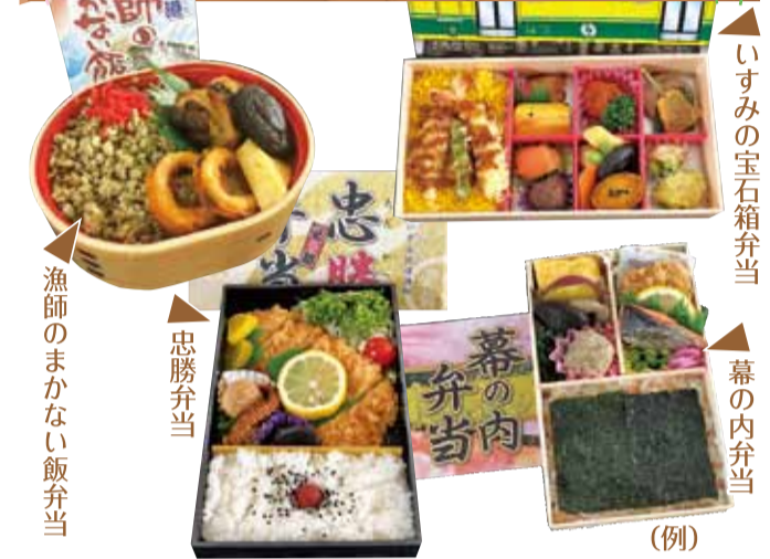
漁師のまかない飯弁当