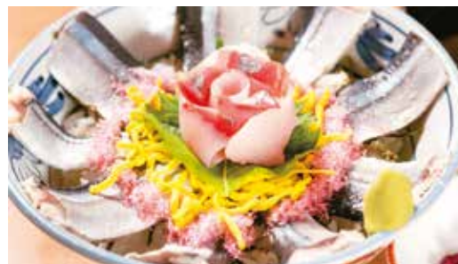
道の駅 鴨川オーシャンパーク