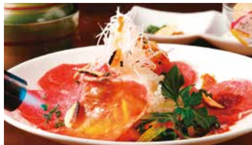
板前ライブダイニングMAIWAI