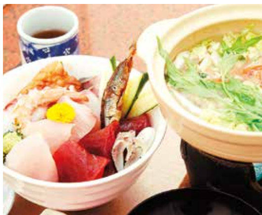
地魚レストラン晴海

「おらが丼」の「おらが」とは「我が家の」という意味。「おらが丼」には鴨川のブランド米である「長狭米」や、地元の新鮮な海の幸、山の幸を主体とするなどのルールがあり、現在、鴨川市商工会に加盟している39の店舗がそのルールを守りながら、和・洋・中など多彩なジャンルの、オリジナリテイ溢れる「おらが丼」を提供しています。