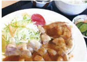
しょうが焼き定食