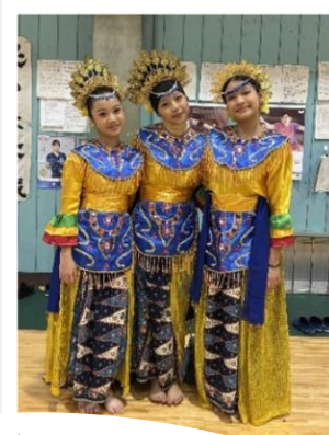
インドネシア交流名物!? 全員参加の「POCO POCO (ポチョポチョ) ダンス」