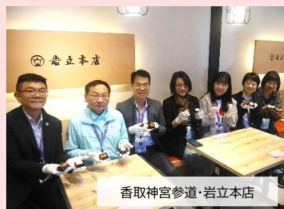
香取神宮参道・岩立本店