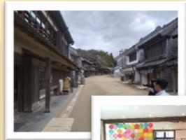
【県内視察】栄町「房総のむら」と、「コスプレの館」