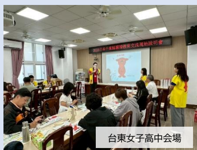
台東女子高中会場

台湾からの訪日教育旅行誘致を促進するため、9月30日～10月2日にかけて台湾を訪問し、学校訪問及び台東県、桃園市の現地学校において千葉県の訪日教育旅行に関する現地説明会を実施。2会場合わせて60名以上の台湾学校関係者が参加しました。