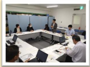
当協会において、訪日教育旅行事業について担当者と意見交換