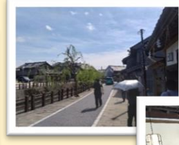
【県内視察】佐原の街並みと、香取神宮参道「岩立本店」での和菓子体験