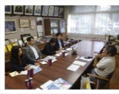
【県内視察】国際交流受入れ校への訪問視察 (県立成田国際高校)