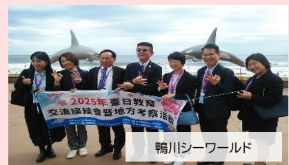
鴨川シーワールド