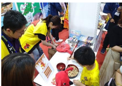
地味に盛り上がる!?落花生つかみゲーム