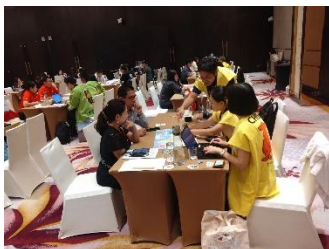
↑クアラルンプール会場