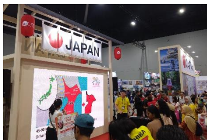
ステージイベントでも本県をPR

以前家族で外家にホームステイをしたことがある 来年また行く予定 ローカル鉄道に乗るのを楽しみにしている