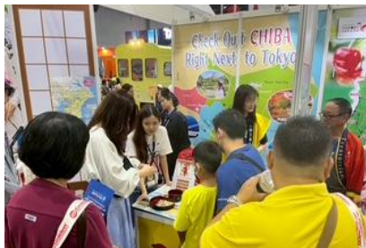
千葉県ブースには絶えず人が訪れました