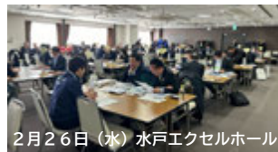
2月26日(水) 水戸エクセルホール