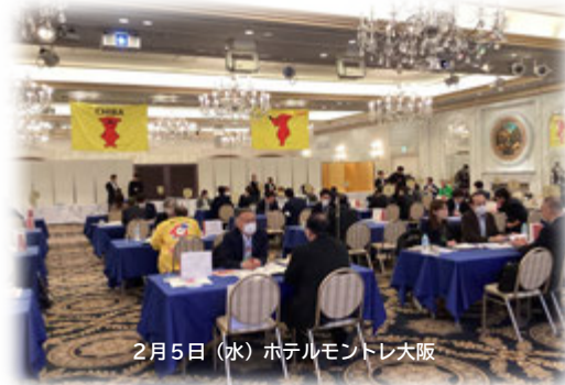
2月5日(水) ホテルモントレ大阪