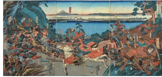
錦絵「北条九代記鴻之台合戦」