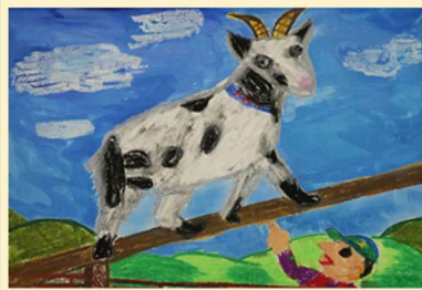
☆ 銀賞 ☆ 綿引 爽真様