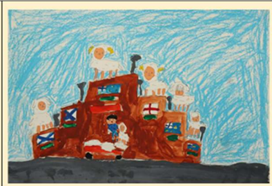
☆ 銅賞 ☆ 星 沙也加様