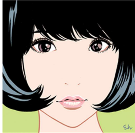
Shiggy Jr.「ALL ABOUT POP」通常版 CD ジャケット (2016) ©2022 Eguchi Hisashi