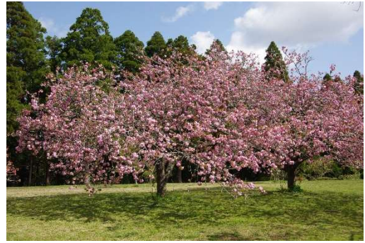
サトザクラ（糸括り）

昭和の森では、3月下旬から4月中旬にかけてソメイヨシノ、ヤマザクラ、サトザクラなど約20種類、約600本の桜が咲き誇ります。