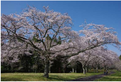
ソメイヨシノ（染井吉野）