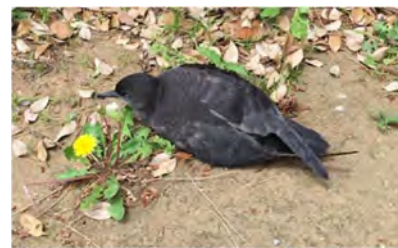
ハジボソミズナギドリ

生態園や青葉の森公園で生活する鳥類や哺乳類、昆虫などの動物を紹介するとともに、日々の生態園で目に付く意外な動物たちをわかりやすく解説します。