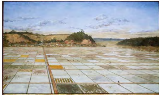
堀江正章 《耕地整理図》1901～1902年