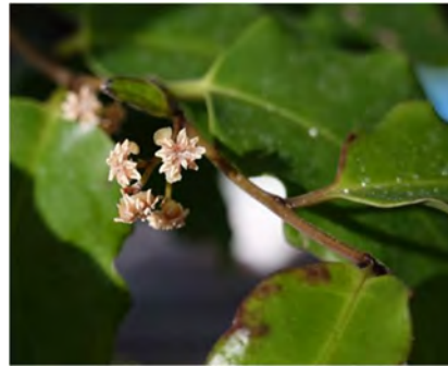
アンボレラ・トリコポーダ

これまで生物は、形や目に見える性質などにより分類されてきました。しかし、近年の DNA 解析技術の向上により、DNA の塩基配列による客観的な生物の再分類が進んでいます。この変化は、図鑑などで科の表記が変わるくらいで、一般の方にはあまり影響するものではありませんが、分類学を基礎としている博物館にとっては根源的な変化です。