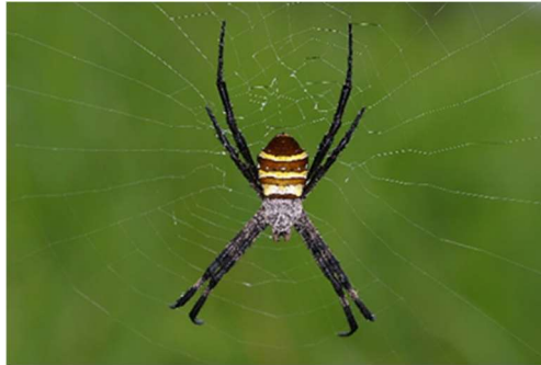
コガネグモ