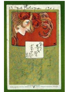
田中半七 浅井忠絵葉書

「絵葉書の時代1」では、1900年開催のパリ万国博覧会の頃、外遊した日本人が祖国に送った絵葉書には、当時流行したアール・ヌーヴォー様式で描かれた女性達や交通網の発達が生み出した観光名所、巷の風物等が溢れています。華やかなりし時代の絵葉書を絵画や工芸品とともに紹介します。