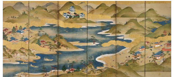
《吉野山・和歌浦図屏風》左隻、紙本着色、六曲一双、江戸時代、個人蔵

本展では、最晩年に収集された《月次風俗図屏風》や《吉野山・和歌浦図屏風》などの初公開の風俗画とともに、コレクションの中でも華やかな源氏物語を描いた作品を紹介します。