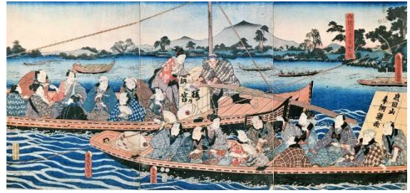
御礼参り最良（ひいき）船之圖 成田山霊光館蔵