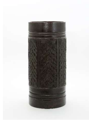
香取 秀真 《雷文花瓶》