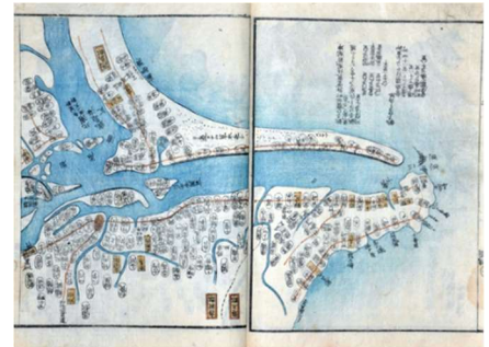
「利根川図示」(当館所蔵)

利根川下流域の千葉県と茨城県の境である「ちばらき」の、古代からの歴史的変遷について紹介します。