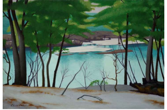
《雪解けの地蔵沼 月山》1980年、油彩、キャンバス、72.7×100.0 cm、作家蔵

佐藤辰作（1952～）は、山形の山河や房総の海を題材に、季節や天候、時間の移ろいの中で、自然の様々な表情をとらえた油彩画を制作しています。澄んだ色彩、緻密な構成による作品から、近年は穏やかな光や風を感じさせる画風へと変化し、その個性は一層深まりをみせています。本展では、静物画や人物画も展示し、初期作から近作まで、佐藤の半世紀にわたる歩みを紹介します。