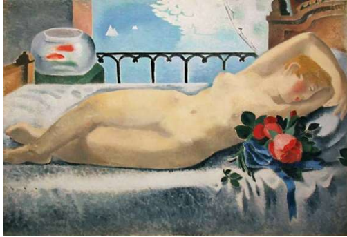
板倉 鼎 《裸婦》