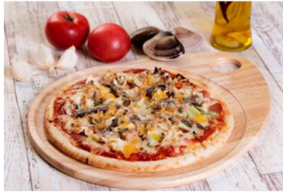
ALBA 9 9ピザ