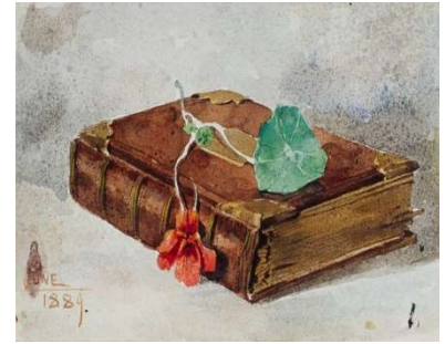
浅井 忠 《本と花》

当館が所蔵する作品の中から、佐倉ゆかりの浅井忠をはじめ、ルノワールなど、特に鑑賞の要望の高い作品を厳選して紹介します。本展では特に、作家の視点や技が冴える絵画、工芸を紹介します。