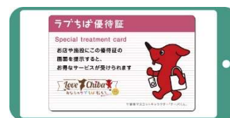
スマホ等でラブちば優待証の画面を提示すると優待サービスが受けられます