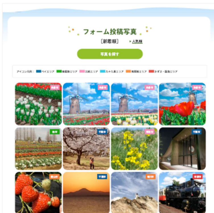
キャンペーン公式サイト

投稿された写真を通じて、今まで知らなかった観光スポットやグルメ、風景など、新たな千葉の魅力を発見していただき、今後の旅にお役立てください。