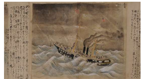
明治二年奥州出征米国船ハーマン号勝浦沖遭難絵巻

戊辰戦争中の1869（明治2）年、新政府軍の熊本藩士らとともに勝浦沖に沈んだ米国蒸気船「ハーマン号」の顛末を伝える絵巻が、新たに千葉県指定有形文化財に指定されました。絵巻の部分展示と併せて新指定絵巻の全体を写真で紹介し、また勝浦市が熊本藩士の遺族及びアメリカ大使館を招いて毎年開催している慰霊祭の様子や、日本水中考古学調査会による潜水調査の成果などもあわせて紹介します。