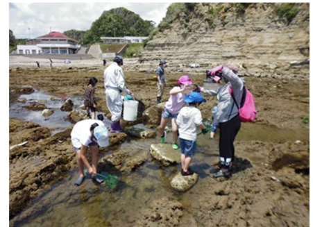
海の生きもの観察ツアーのようす