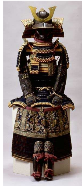
紺糸威鎧（こんいとおどしよろい）