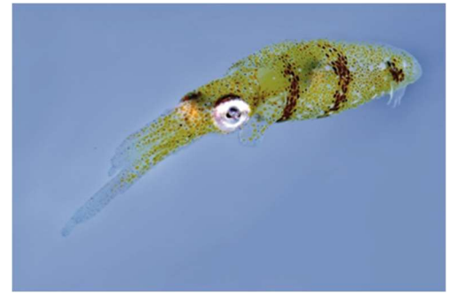
世界最小のイカ・ヒメイカ