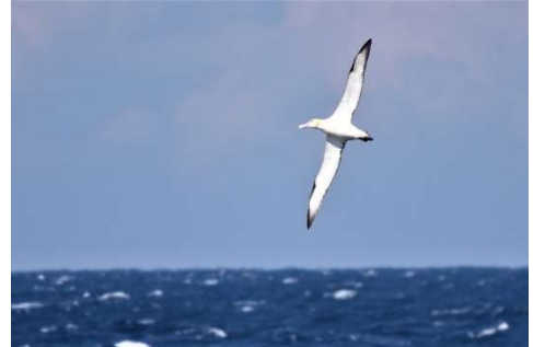
大海原を翔けるアホウドリ