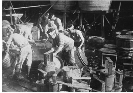
「酒の仕込みの様子」（香取市教育委員会蔵）