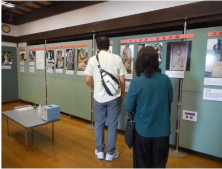
パネル展「雲と、お天気」