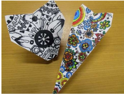
折紙ひこうきデザイン（スタッフ作成見本）