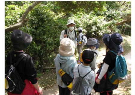
鵜原理想郷 花と歴史散歩のようす