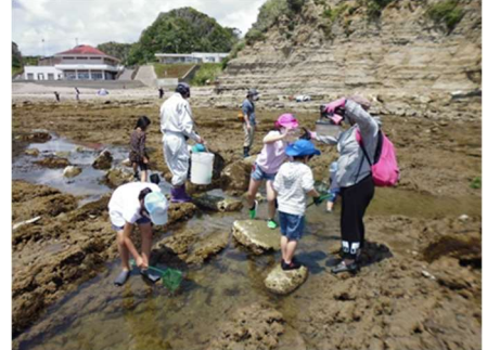
海の生きもの観察ツアーのようす