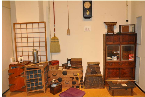
「古い道具と昔の暮らし」展示の様子