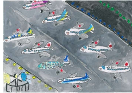
折紙ひこうきデザイン（スタッフ作成見本） こうくう自由絵画（2020年館長賞作品）