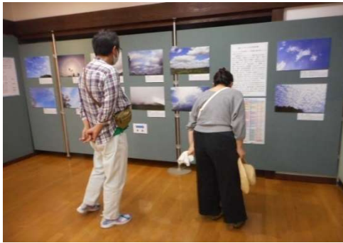
パネル展「雲と、お天気」