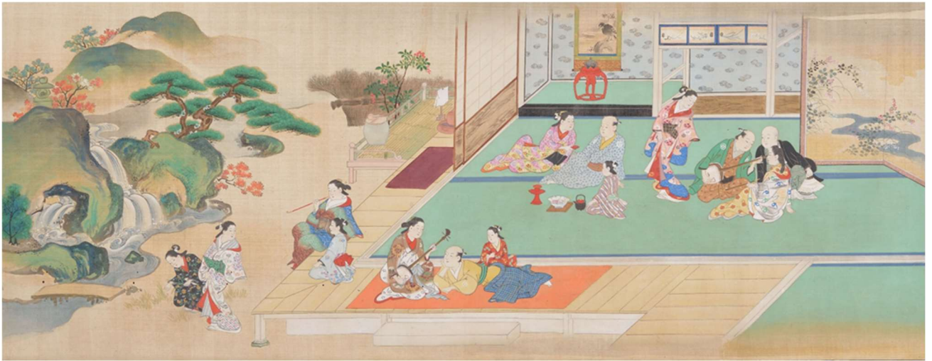
宮川長春《江戸風俗図巻》部分、絹本着色、二巻、享保（1716～36）