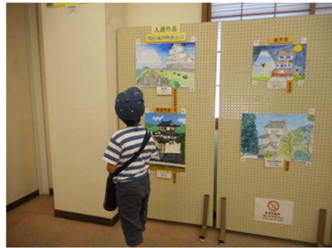
関宿城写生コンクール作品展