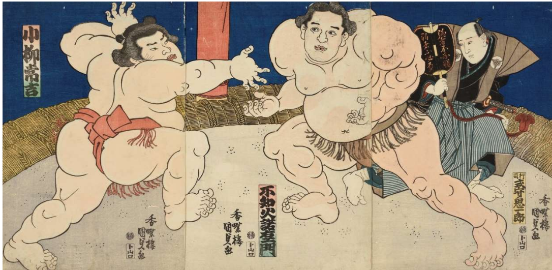
歌川国貞《不知火諾右衛門・小柳常吉》大判錦絵 3 枚続、天保 11～13 年（1840～42）