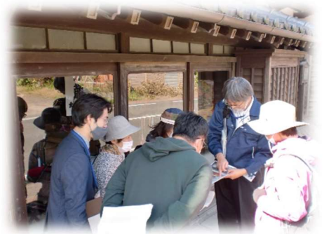
街並み探検の様子

・コース（予定）：藻原寺－長生合同庁舎（旧南総鉄道跡）－昌平町－稲荷神社（天然瓦斯貯蔵場跡）－本町－旧長生郡役所玄関