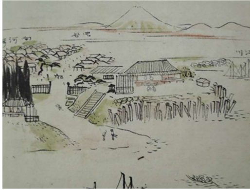
関宿関所の図『関宿土産』