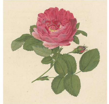
レーシヒ『バラ彩色図譜』より No.11 Rosa Francfortensis L.

植物学、園芸、美術史等さまざまな視点からバラのすべてをお見せします。 レーシヒの『バラ彩色図譜』などの貴重書やアール・ヌーヴォーのガラス工芸、 浮世絵、和書と現代の絵画等、貴重な資料がかつてない規模で集結。古今東西 愛され続けるバラの魅力の奥深さに触れてください。