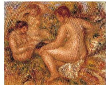
ルノワール《三人の浴女》 埼玉県立近代美術館所蔵