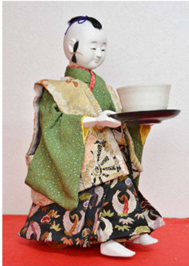
「茶運び人形」 榎本誠治