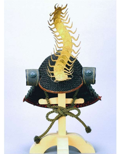
てついちまいぼりなんぼんくまりかぶと 鉄一枚張南蛮鎖 兜

戦において頭を保護する防具である兜は、戦の変化にあわせて発達を遂げてきました。また、身につけた武士の戦に対する意識・価値観なども装飾という形で兜に表現され、武士が自らを表現する手段となりました。動物、植物などをモチーフに意匠を凝らした変わり兜は、当時の美意識の結晶であったといえます。一方、私たちの身の回りには、その形態が兜に似ていることを由来として「カブト」を名乗る動・植物が多く生存しています。今回の展覧会では、「かぶと」を取り上げ、意匠を凝らした変わり種兜と「かぶと」にまつわる動・植物を紹介します。