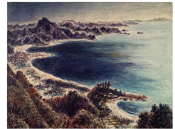
時田直善《崖の観音》

風光明媚な景観と都心に近いという地の利から、古くから多くの作家が訪れた房総の自然景観を描いた作品を中心に、時代とともに変貌を遂げた県内各地の様々な景観を描いた作品を紹介します。