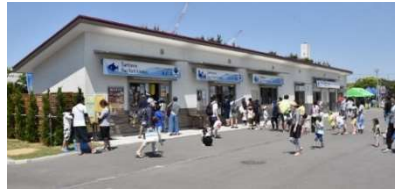
三番瀬海浜公園潮干狩り2022