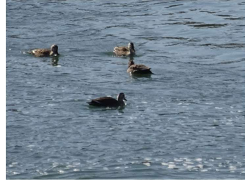
パネル展「川辺の鳥たち」