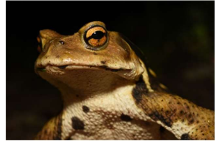
アズマヒキガエル

中央博物館に併設されている自然観察エリア、生態園でのトピックス展示です。今回のテーマは「カエル」。生態園にも生息する種類から千葉県では見られない種類まで、たくさんの個性的なカエルが大集合します。