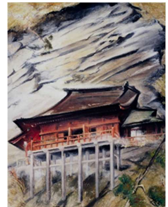
時田直善《崖の観音》

風光明媚な景観と都心に近いという地の利から、古くから多くの作家が訪れた房総の自然景観を描いた作品を中心に、時代とともに変貌を遂げた県内各地の様々な景観を描いた作品を紹介します。