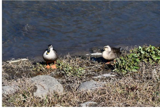
パネル展「川辺の鳥たち」