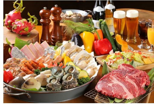
SURFTURF ガーデン BBQ プラン (食材見本)