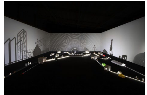
【参考】クワクポリョウタ 《LOST#16》

クワクポリョウタ(1971～)は、電子機器をはじめ様々なメディアを使用して作品制作を行う、メディアアート界を牽引するアーティストです。本展では、千葉県誕生 150 周年を記念して、クワクボと千葉県のマスコットキャラクターであるチーバくんが掛け合いをしながら千葉県の地理、自然、産業、文化等さまざまな側面からリサーチを重ね、「房総の海」をテーマに、光と影によるインスタレーション作品を新規発表します。