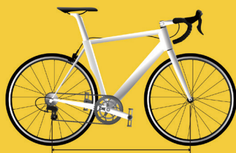
ホイールベース表を参照