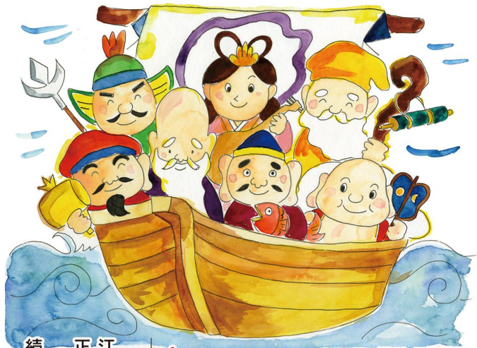
イラスト 三條 栄子

七福神は、七つの幸せを与える福神です。江戸時代、七福神を宝船に乗せた絵が広まり、正月の七福神もついでが盛んになりました。ながれやま七福神は、流山の発展を見守り続けております。